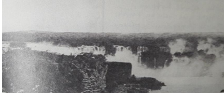
A cachoeira de iguassu. Foto publicada no livro The New Brazil de Marie Robinson Wright, 1907

Fotos publicadas no Livro The New Brasil