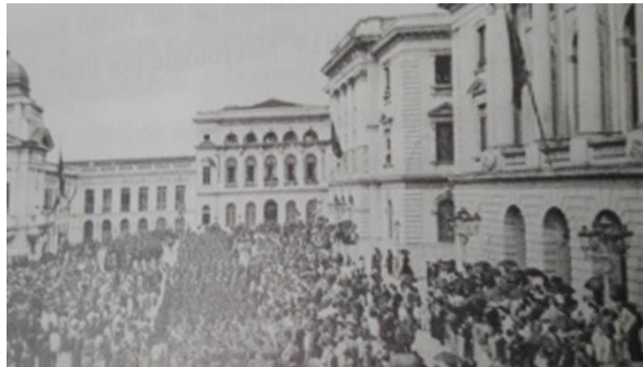
Largo do Palácio. Foto publicada no livro The New Brazil de Marie Robinson Wright, 1907