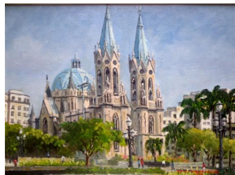
Catedral da Sé